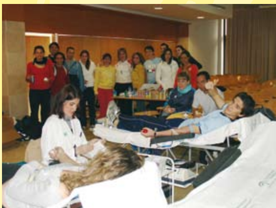
Alumnos y profesores pasaron por el centro de donación instalado en el aula de grados.