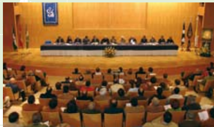
Representantes de 65 corporaciones rocieras abarrotaron el salón de actos.

En el curso del acto, el hermano mayor de la corporación bormujera, impuso la medalla de la hermandad al presidente de la Fundación San Pablo Andalucía-CEU (en la imagen).